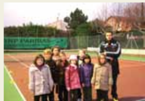
Cours supplémentaire enfants