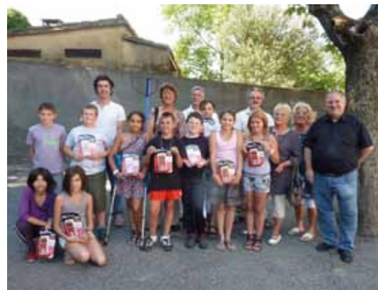
Remise des calculatrices aux élèves de CM2 passant en 6°

Site des écoles : www.ac-grenoble.fr/ecole/lacoucourde/