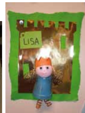
Princesses et chevaliers de la classe.