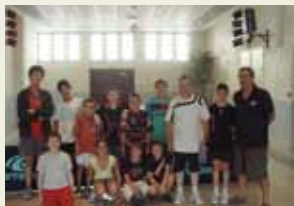
Section Ping Pong - Équipe 1