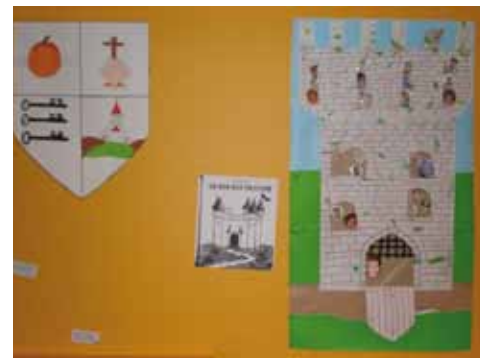
Le château des anniversaires